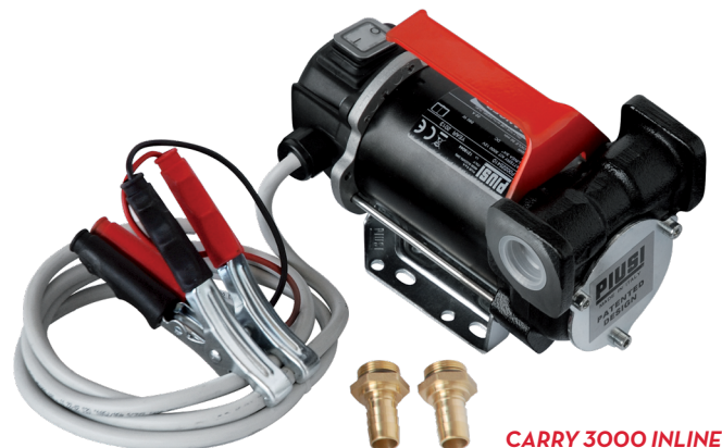
CARRY 3000 INLINE