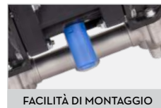
FACILITÀ DI MONTAGGIO