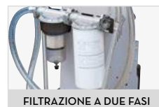
FILTRAZIONE A DUE FASI