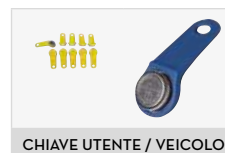
CHIAVE UTENTE / VEICOLO