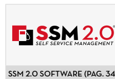
SSM 2.0 SOFTWARE (PAG. 34)