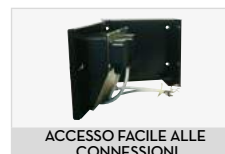
ACCESSO FACILE ALLE CONNESSIONI