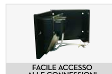
FACILE ACCESSO ALLE CONNESSIONI