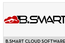
B.SMART CLOUD SOFTWARE