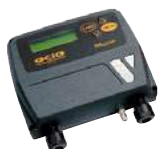
INDICATORE DI LIVELLO