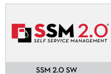
SSM 2.0 SW