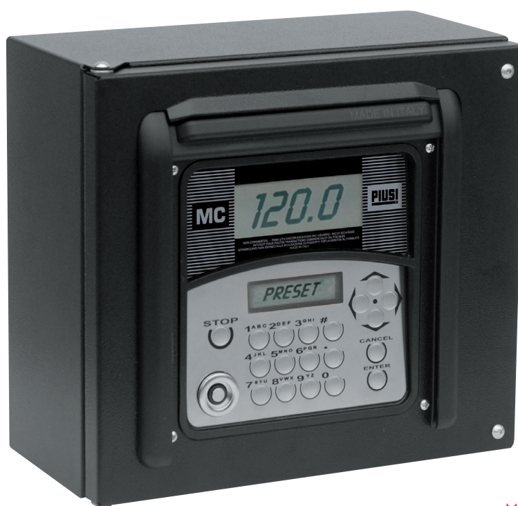
MC BOX 2.0