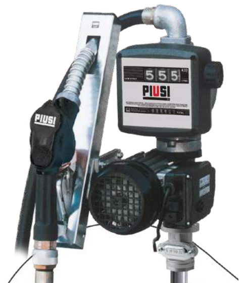
DRUM PANTHER 56 K33