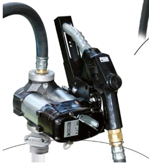
DRUM BIPUMP 12V