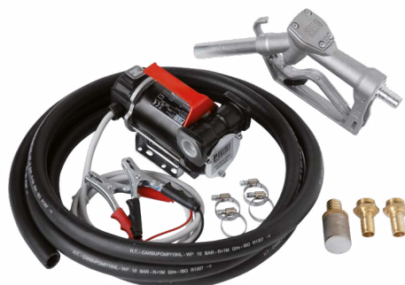
BATTERY KIT 3000 INLINE