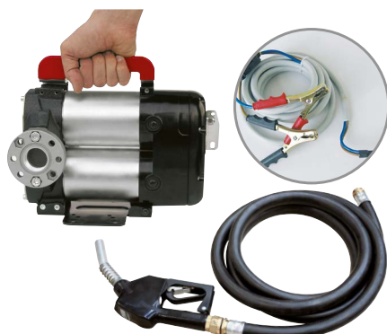
BATTERY KIT BIPUMP

ANY BIODIESEL ARIA ANTIGELO AdBlue® BIODIESEL DIESEL ALIMENTI BENZINA GRASSO KEROSENE OLIO ACQUA LAVAVETRI