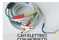
CAVI ELETTRICI CON MORSETTI