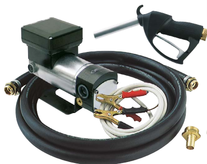
BATTERY KIT OIL